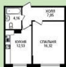
1 к. кв. 38,06 м 2