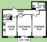
2 к. кв. 60,48 м 2