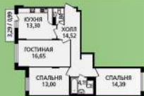
3 к. кв. 78,88 м 2