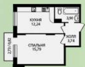
1 к. кв. 36,49 м 2