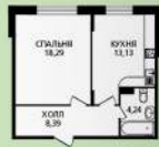
1 к. кв. 44,05 м 2