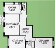
3 к. кв. 96,22 м 2

Однокомнатные квартиры - это отличный вариант для молодых семей, мечтающих жить отдельно; молодых специалистов, для которых эта квартира может стать первым собственным жильем, стартом новой карьеры и новой жизни; для пенсионеров, намеренных вести активный образ жизни и привыкших жить в городской черте.